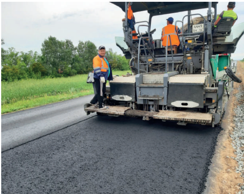
Новосергиевские дорожники ликвидировали колеиность, но и добавили дороге ширины

Современные технологии позволяют дорожникам сокращать затраты, но при этом делать качественные дороги, которые служат дольше. Учитывается все: ландшафт местности, наличие мостов, нагрузка. К примеру, есть трассы с интенсивностью движения 200 автомобилей в сутки, а есть такие, где проезжает по 12 тысяч. Многое зависит и от того, какие деньги закладываются в ремонт