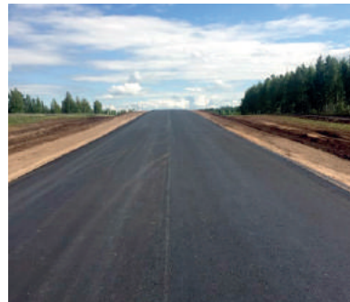
Водители успели оценить новую дорогу на подъезде к селу Сакмара

лась вода, поэтому дорожникам пришлось вскрывать их и практически заново делать полотно.